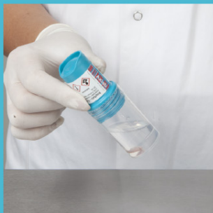
De formaldehyde loopt in de container en omringt het biopt