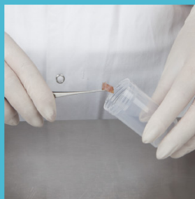
Plaats het biopt in de container