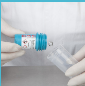
Schroef de BiopSafe dop er af