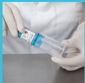
Schroef de BiopSafe dop er op