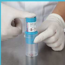
De formaldehyde wordt vrijgegeven met een druk op de dop