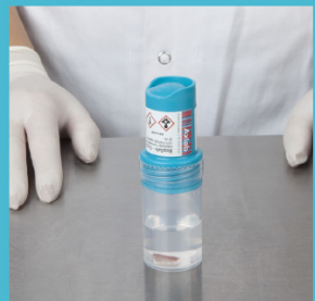
Het biopt is klaar voor transport